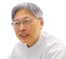
ジェイコー JCHO 湯布院病院 診療顧問

最後に私事ですが、本年3月に定年を迎え、今は任期付き医師として勤めております。副院長在任中のご厚誼に深謝いたします。今後ともどうぞ宜しくお願い申し上げます。