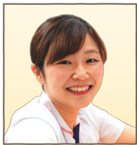
Sさん 回復期リハビリテーション病棟

入社当初から回復期リハビリテーション病棟で勤務していました。育休復帰後から手術室看護への興味と子育てとの両立を考え、手術室で勤務をしています。手術室看護は専門性も高く、両立が大変な事もありましたが、充実した教育体制と子育て世代に温かい職場風土に支えられました。現在は二人の子育てと両立しながら副看護師長として頑張っています。勤務体制が配慮されており多くの子育て世代が働いている、働きやすい職場です。