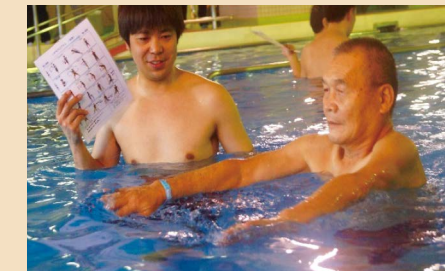
プール専属の理学療法士による効果的なりハビリテーション