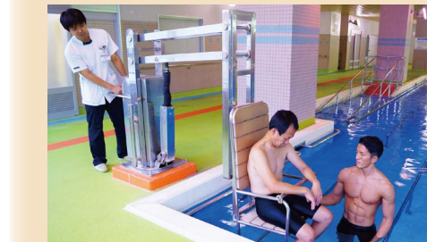
最新の設備を導入しているので安全・安心