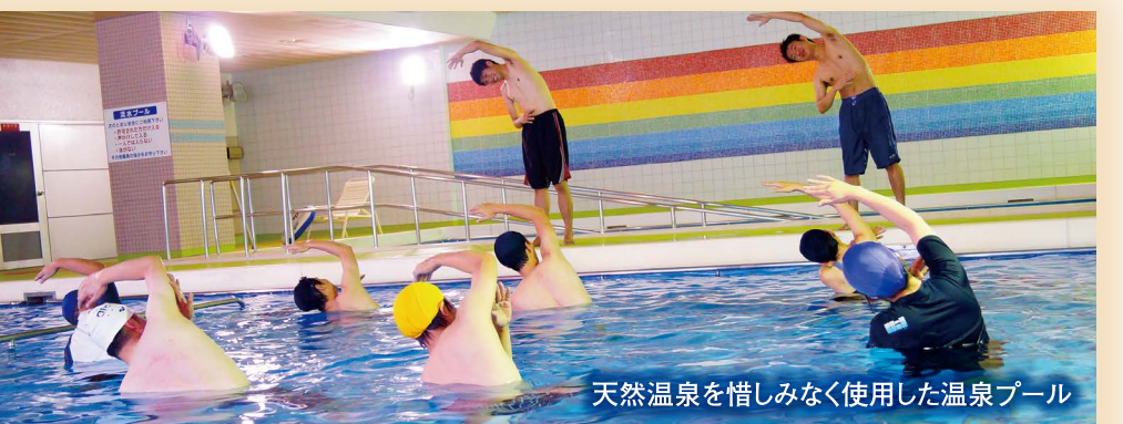
天然温泉を惜しみなく使用した温泉プール