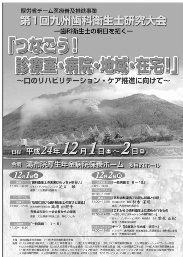
図 2 : 九州歯科衛生士研究大会 ポスター